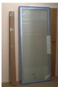
(so wird die WIN-Schiebetür geliefert)