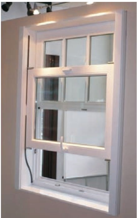
. . . der Hochschiebeflügel kann stufenlos hochgeschoben werden