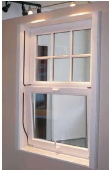
. . . zum Öffnen wird der Hochschiebeflügel oben abgekippt . . .