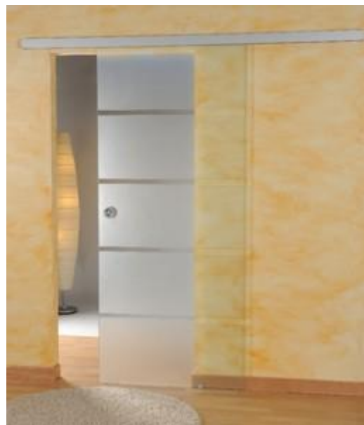
LS8, 3056 matt, Griffmuschel