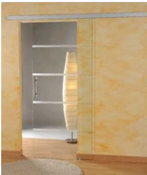
LS8, 3056 klar, Griffstange