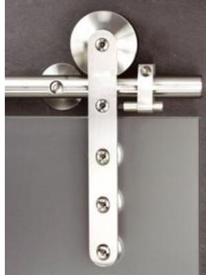
(Abb. ST4 mit 3 Haltepunkte)

Beschläge Edelstahllaufschiene Länge = doppelte Türblattbreite mit 4 Befestigungspunkte 4 Stck Wandhalterungen ST3 D = 60 mm Standardwandabstand 20 mm von Wand zum Glas auf [ ] mm Wandabstand ändern (min = 13 mm max = 46 mm) [ ] 2 Stck Laufwagen ST4 mit 3 Glashaltepunkte [ ] dito, aber mit 2 Glashaltepunkte